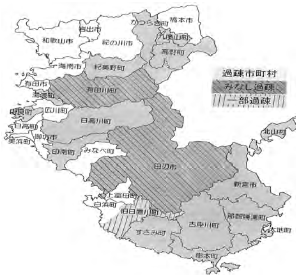
〈和歌山県提供資料より〉

における対象地域は 18 市町村（うち過疎地域とみなされる区域を有する市町村：1 市 1 町、一部過疎市町村 1 町）であり、全市町村数の 60% が過疎市町村とされている。面積では県全体の約 3/4 を占めるが、人口は約 1/4 であり、人口密度も全县平均の約 1/3 程度となっている。地理的には約 85% が森林地域で、耕地は約 4% であり、大部分が内陸部又は県南部に位置している。